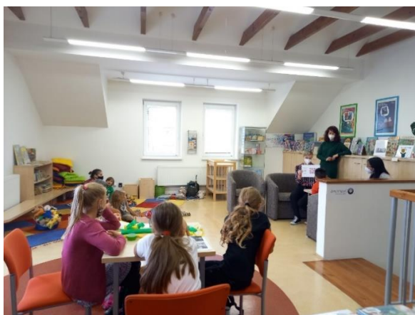
Workshop s dvojjazyčným čtením vietnamské pohádky O narcise, besedou a výtvarnou dílnou, Zahradní slavnost, pobočka Maloměřice, 17. 9. 2021

Cílem projektu bylo vrátit se v rámci knihovny podrobněji k tématu její role jako aktéra integrace, prohloubit zájem cizinců o služby knihovny a navázat hlubší spolupráci s interkulturními pracovníky MMB. Dále jsme chtěli začít mapovat potřeby cílové skupiny cizinců a nastavit procesy postupného snižování interkulturních bariér v knihovně. Abychom pracovali efektivněji, zaměřili jsme se v roce 2021 primárně na komunity Ukrajinců a Vietnamců žijících v Brně, do kterých jsme měli díky stávajícím kontaktům knihovny a především spolupráci s interkulturními pracovníky města lepší přístup.