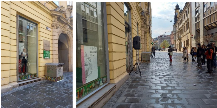
Bezpečné autorské čtení, Brno Art Week 2021, 20. 4. 2021.

Již v době hlubokého lockdownu v první půlce roku 2021 jsme se aktivně podíleli na udržování kulturního života v Brně. Podpořili jsme Brno Art Week 2021 uspořádáním speciálního formátu živého „Bezpečného autorského čtení“, které se uskutečnilo 20. 4. 2021 v mezích epidemiologických opatření. Mladí básníci a prozaici četli své texty uvnitř výlohy Ústřední knihovny na Koblížně a jejich hlas byl přenášen reproduktory do venkovního prostoru, současně byly texty promítány na monitor obrazovky ve výloze k přímému čtení.