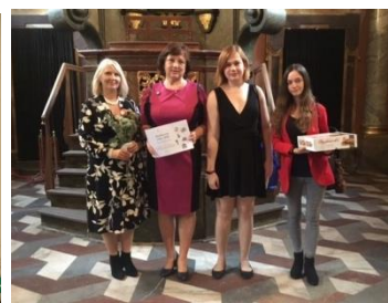
Knihovna roku 2021 18. 10. 2021