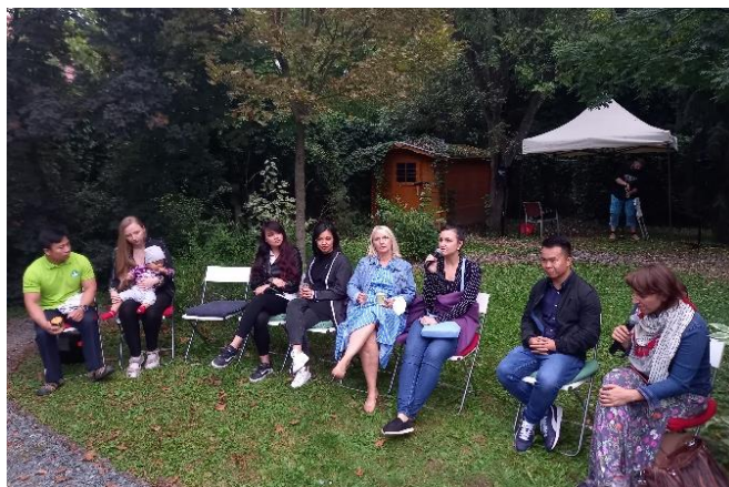
Moderovaná diskuse na téma život Vietnamců v Česku, Zahradní slavnost, 17. 9. 2021

Díky projektu se nám podařilo navázat na dřívější aktivity knihovny, která se v oblasti integrace pohybuje již více než 15 let, a tyto systematicky uchopit. Projekt také umožnil navázat úzkou spolupráci s týmem interkulturních pracovníků, díky kterým jsme mohli dostat informaci o knihovně a jejích službách do komunit cizinců a položit základy pro další dlouhodobou spolupráci, také nad rámec projektového financování. Zároveň jsme díky mapování interkulturních bariér uvnitř knihovny, při které nám byli interkulturní pracovníci díky své odbornosti také velmi nápomocní, mohli označit místa v knihovně, kde již věci dobře fungují, jinde je naopak prostor pro rozvoj nebo se projeví potenciální hrozby.