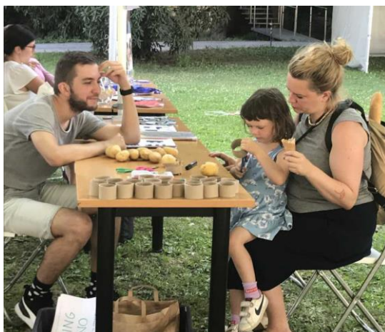
Workshop Zubr si hledá hnízdo na festivalu MEETING BRNO, 30. 7. 2021.