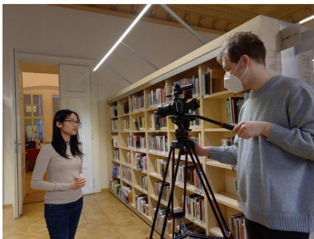
Natáčení propagačního videa v rámci projektu Integrovaná aktivita v Knihovně Jiřího Mahena. Výsledný výstup, ve kterém zazněla vietnamština, ukrajinština a slovenština opatřený titulky v češtině a angličtině je dostupný také na youtube, https://youtu.be/7BJJ8VaWebY .

Díky projektu jsme vytvořili nový formát akce pro mezikulturní setkávání - Zahradní slavnost, který plánujeme uplatnit i v příštím roce, ověřili jsme fungování vzdělávacího workshopu pro děti s dvojjazyčným čtením, výtvarnou dílnou a besedou a podařilo se nám uspořádat celkem 4 tlumočené exkurze pro Vietnamce a Ukrajince žijící v Brně, díky kterým jsme rozšířili své portfolio kontaktů na tlumočníky a lektory-rodilé mluvčí, jejichž činnost je blízká interkulturní práci. Vznikly také překlady materiálů informujících o službách knihovny ve vietnamštině, ukrajinštině a ruštině. Dále jsme vyrobili video představující Knihovnu Jiřího Mahena v Brně jako místo setkávání pro všechny obyvatele města.