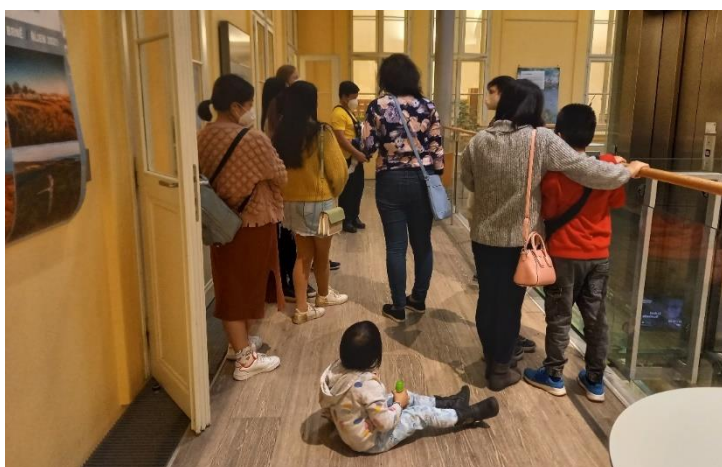
Exkurze do Ústřední knihovny tlumočená do vietnamštiny, 11. 10. 2021, projekt Integrované aktivity v Knihovně Jiřího Mahena 2021

I v roce 2021 do realizace projektových aktivit významnou měrou zasáhla opatření omezující provoz v kultuře v důsledku řešení pandemické situace šíření onemocnění Covid-19, avšak díky zkušenostem z loňského roku jsme byli na měnící se podmínky pro pořádání kulturních akcí schopni rychle reagovat a realizaci aktivit přizpůsobovat aktuální situaci, např. úpravou programu nebo přesunem akce do online prostředí.