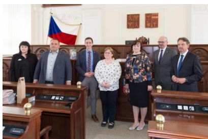
TOP Komunitní knihovna JmK 2020 – 14. 10. 2021

Knihovna získala nejvyšší ocenění MK ČR – Knihovna roku 2021 v kategorii významný počin v oblasti veřejných knihovnických a informačních služeb za projekt Knihovna Na Křižovatce. K ceně blahopřál ministr kultury Lubomír Zaorálek (18. 10. 2021).