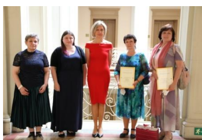
Poděkování Krajské hygienické stanice 10. 6. 2021